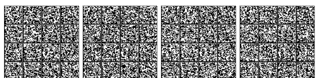
Tabella V4- 4: Parametri progettuali per la rete idranti secondo UNI 10779